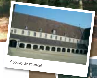
Abbaye de Moncel