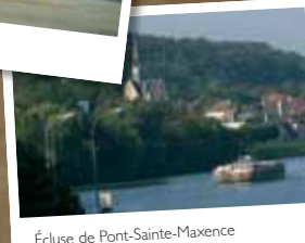
Écluse de Pont-Sainte-Maxence